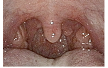
子供の扁桃腺とアデノイド